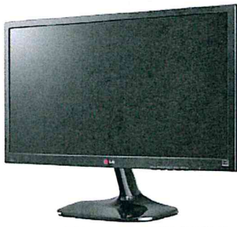
Televisor LED 22"LG